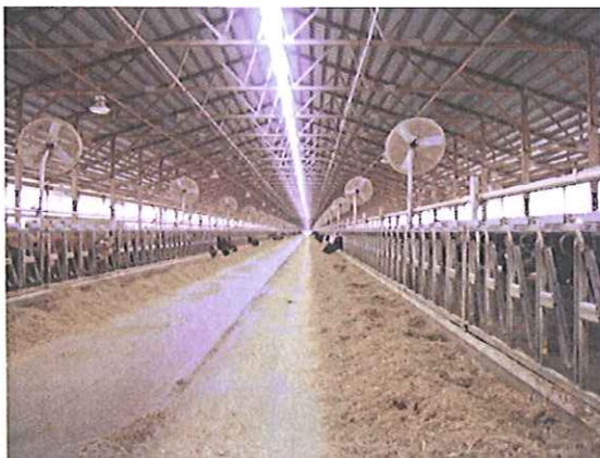
一棟 3000 頭の牛舎

ジャージーは、エネルギー（飼料）効率がよく病気も少ないそうです。成分乳価の高いアメリカでは、有利であると Gordie 氏は述べています。