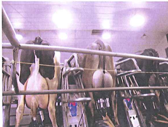
72 ポイントロータリーパーラー

今は、この農場も含めたコンサルタントの仕事を中心に、国外でもおこなっているそうです。