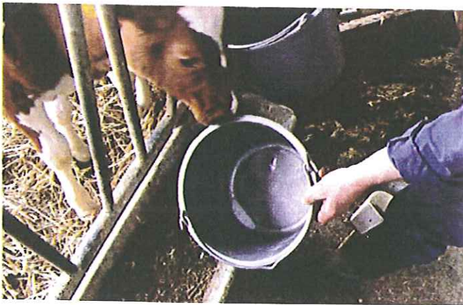
特に夏場は水を切らさないでネ