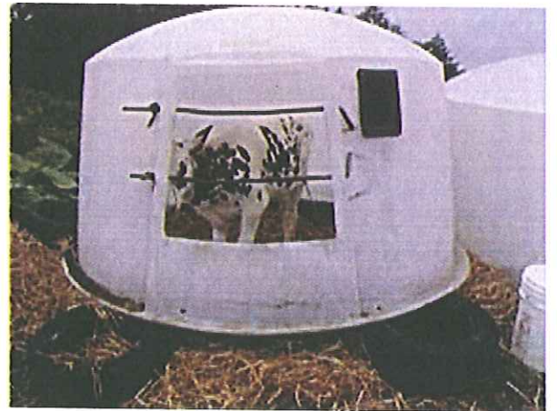
ハッチの下にタイヤを入れ通気を改善