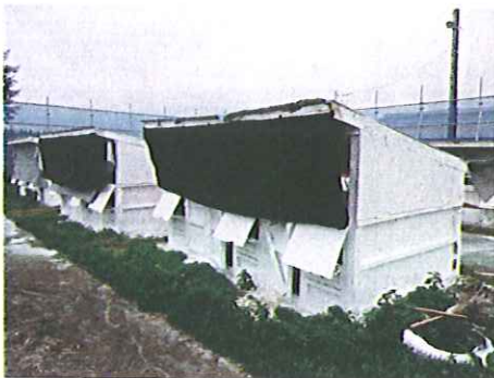
遮幕で直射日光を遮断 ハッチを北向きにするのも有効