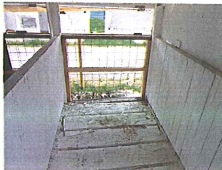
ハッチの奥の壁をメッシュに変更。壁は開閉可能なように改造。