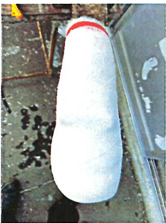
キャストを巻く。キャストαを2ロール使えば足りる。