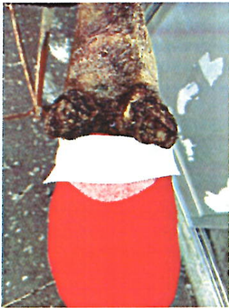
左：副蹄の下にガーゼを当てる