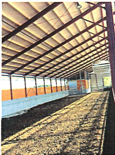
【牛舎内…フリーバーンです】