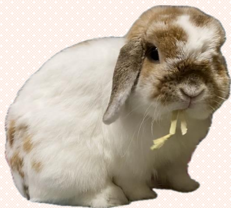
実家のアイドル 橙(だいたい)♂